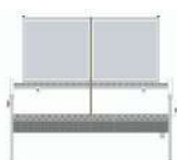
Rampe lave-mains raccordable sur pieds 4 à 12 postes