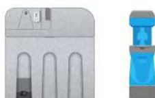
Double lave-mains autonome